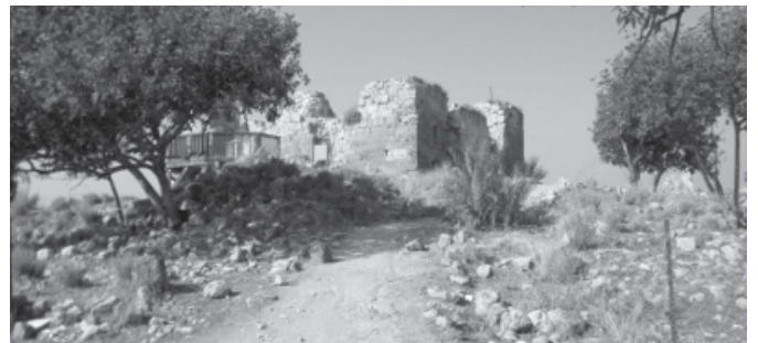
פה ישב חיל משלוח עירקי שהטריד את תושבי עמק חפר

הם הוקמו על קו הגבול במבנה אורכי כדי לשמש מגן על העמק ועל "המותניים הצרים" של המדינה.